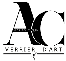
Atelier Adrian Colin, Côtes d'Armor.