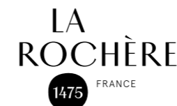
Verrerie La Rochère, Haute-Saône.