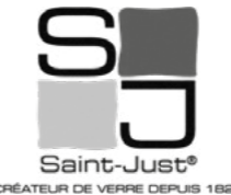
Verrerie de Saint-Just, Loire.