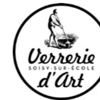
Verrerie d'Art de Soisy-sur-École, Essonne.