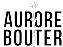
Atelier Aurore Bouter, Bouches-du-Rhône.