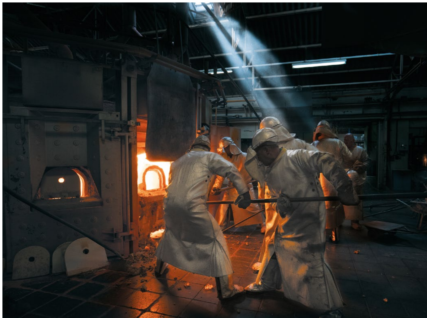
© Manufacture Lalique - Séquences Studio